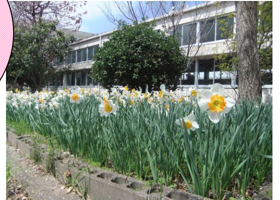
阿工癒しスポット② 機械棟南側 スイセン花壇

いよいよ新しい年度がスタートしましたね！新入生のみなさんは、ご入学おめでとうございます！！ 2・3年生のみなさんは、新入生が早く阿工での生活になじめるよう、みんなで平和な学校の雰囲気を作りましょう☆