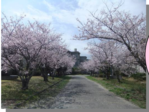
阿工癒しスポット① 正門右通路の桜並木

いよいよ新しい年度がスタートしましたね！新入生のみなさんは、ご入学おめでとうございます！！ 2・3年生のみなさんは、新入生が早く阿工での生活になじめるよう、みんなで平和な学校の雰囲気を作りましょう☆