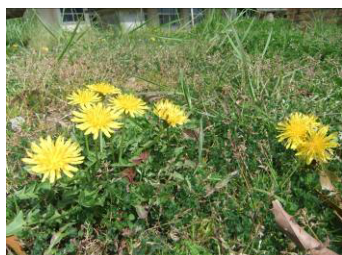
阿工癒しスポット③ かまどベンチ横タンポポ

わかりにくいですが、ここに入出口があります。 ※小窓からは入れません。念のため。