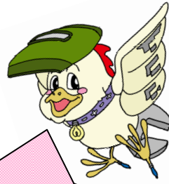
阿工マスコットキャラクター“阿鳥夢 (あとむ) くん”