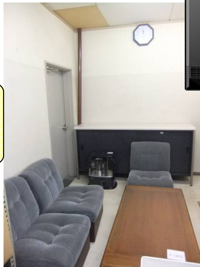
↑部屋の中はこんな感じ。ソファーもあります♪