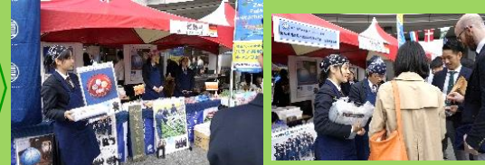
(東京スカイツリー ソラマチひろば)