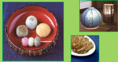
藍の和菓子・餃子、藍染(阿波和紙)行灯