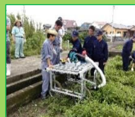
(協力: 県農総技センター)