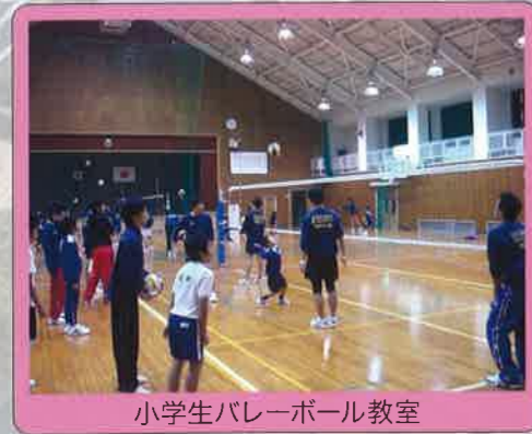
小学生バレーボール教室