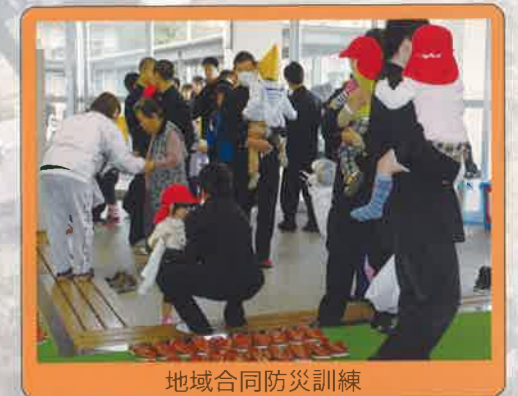
地域合同防災訓練