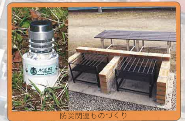
防災関連ものづくり