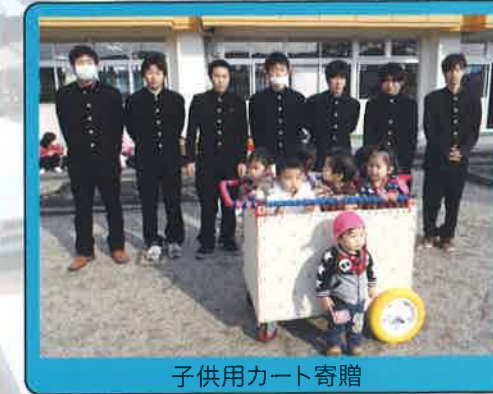
子供用カート寄贈