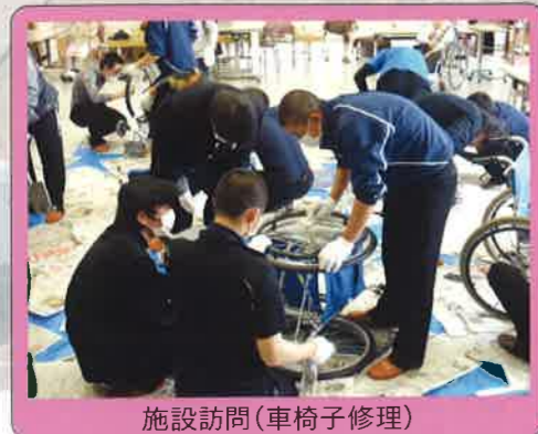
施設訪問(車椅子修理)