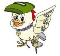
阿南工業高校マスコット 阿島夢(アトム)くん

今年度も楽しい学校生活が送れるよう一人ひとりが協力していきましょう。そして、一つひとつの学校行事を成功させ、すばらしい思い出となるよう全力で頑張ります。