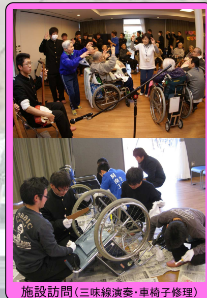
施設訪問(三味線演奏・車椅子修理)