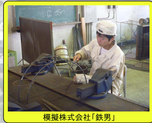
模擬株式会社「鉄男」