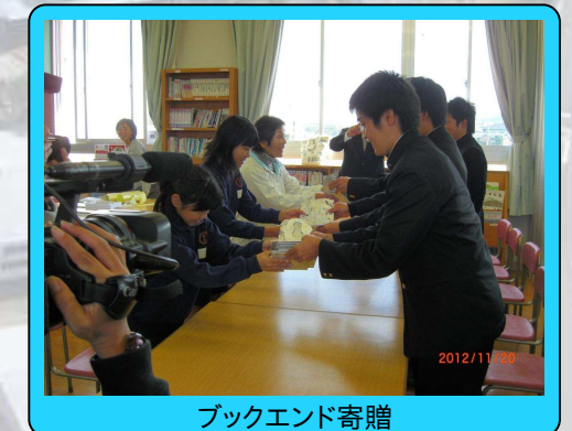
ブックエンド寄贈