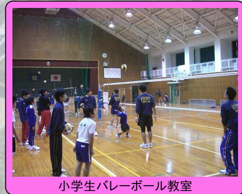
小学生バレーボール教室