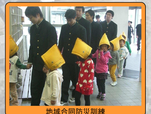
地域合同防災訓練