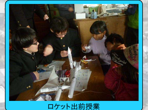
ロケット出前授業